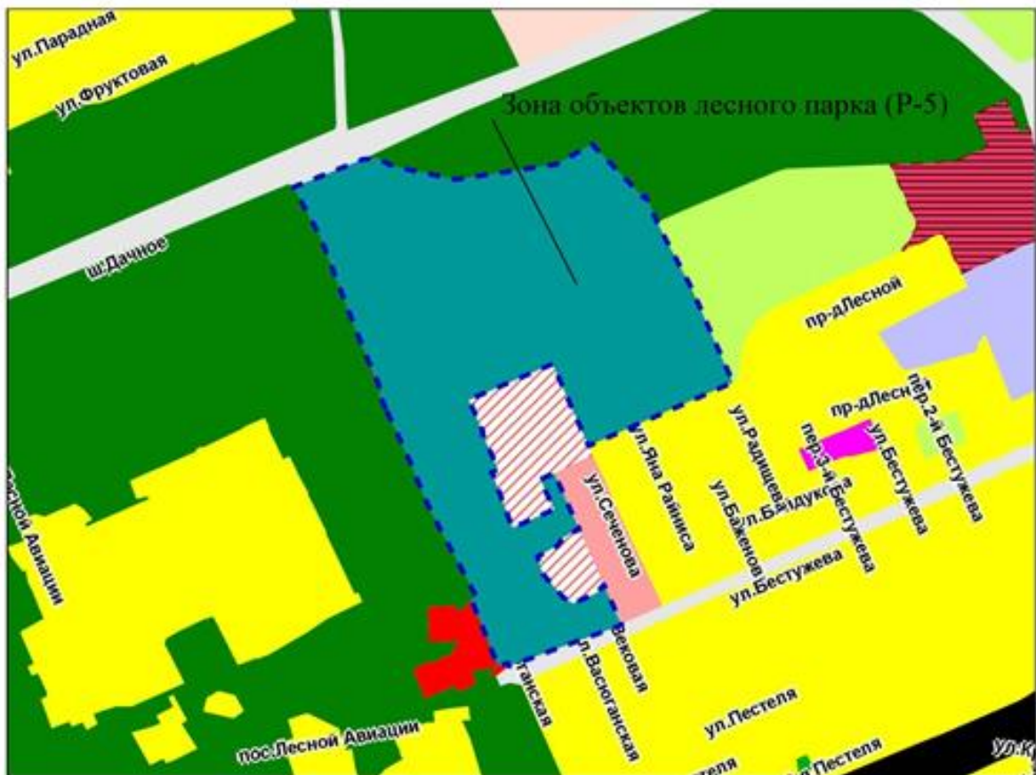
Фрагмент карты градостроительного зонирования территории города Новосибирска