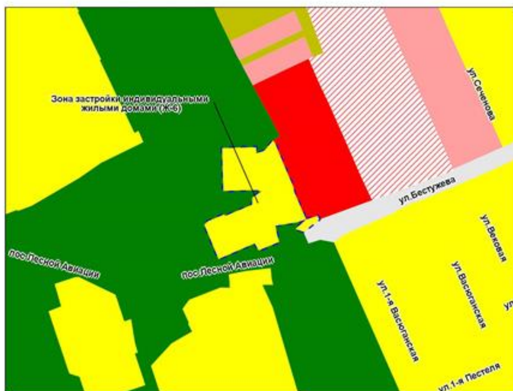
Фрагмент карты градостроительного зонирования территории города Новосибирска