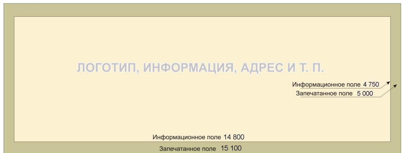
Схема печати 5*15

2.2. Приложение к рекламно-информационному материалу документов, подтверждающих его соответствие всем требованиям, где должны быть указаны его характеристики (тип, производитель, плотность, плетение нити).