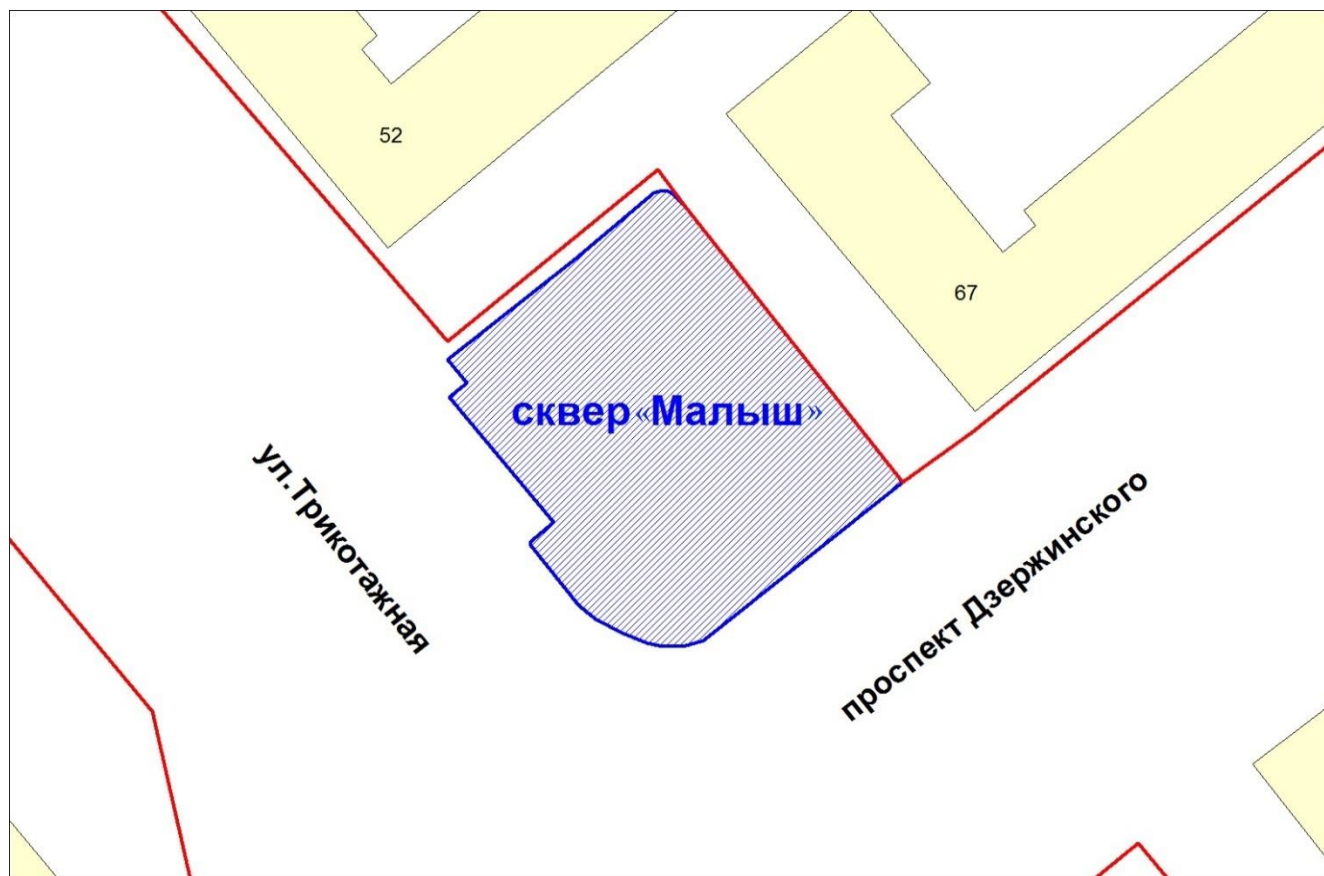
СХЕМА расположения сквера «Малыш» в Держинском районе

Примечание: — – именуемый элемент планировочной структуры; — – существующие элементы улично-дорожной сети.