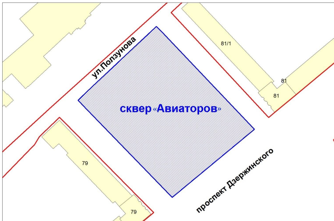
СХЕМА расположения сквера «Авиаторов» в Держинском районе

Примечание: — именуемый элемент планировочной структуры; — существующие элементы улично-дорожной сети.