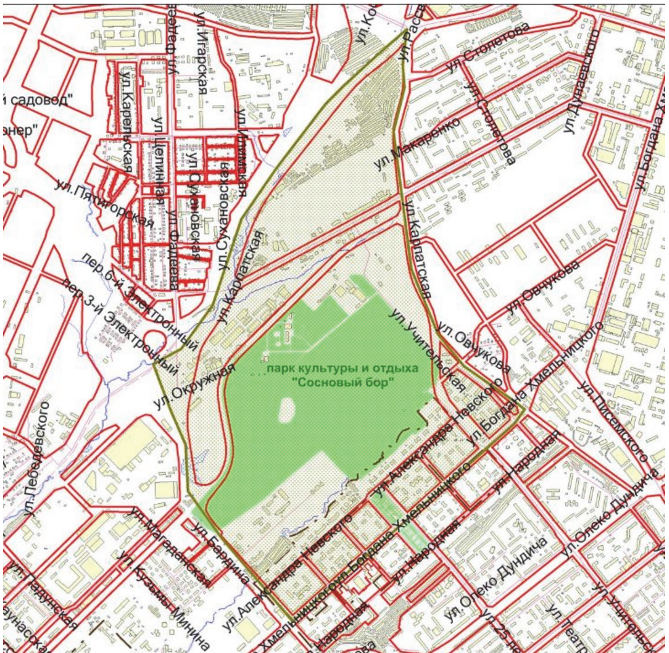
СХЕМА границ территории, прилегающей к парку культуры и отдыха «Сосновый бор», в Калининском районе